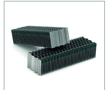
Wellennägel Type WN